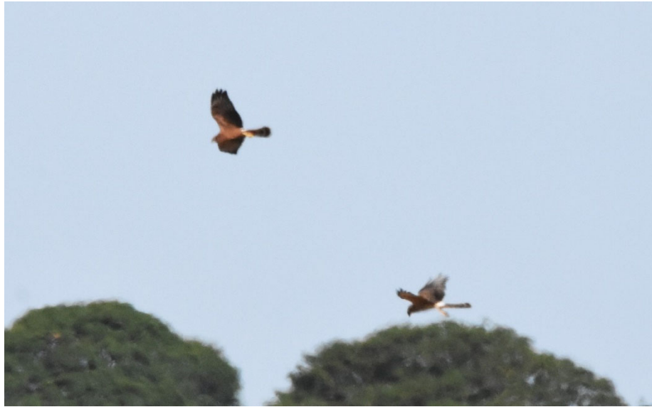
Busard St Martin dont la plaine de Thudinie est capitale pour le maintien et le développement de l'espèce en Wallonie.