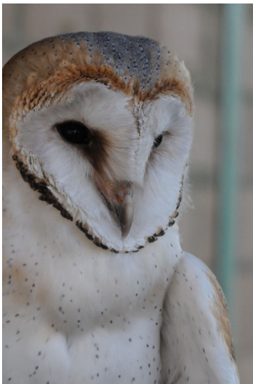
Chouette effraie sous l'auvent d'un hangar au milieu des plaines, à quelque 2,5 km des éoliennes – 3 à 5 jeunes / an